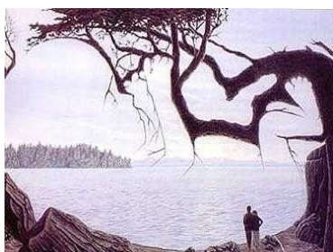
¿A ver si ves al bebe?