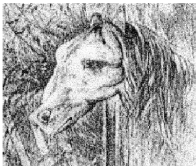
El caballo y la Rana